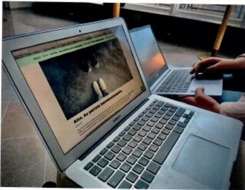
Yliopisto-opiskelijat siirtyivät käyttämään Sisu-järjestelmää koronapandemian aikana.

Helsingin yliopiston tietojenkäsittelytieteen professorin Jussi Kangasharjun mukaan on tyypillistä, että keskeneräisiä ohjelmistoja lähtee ulos.