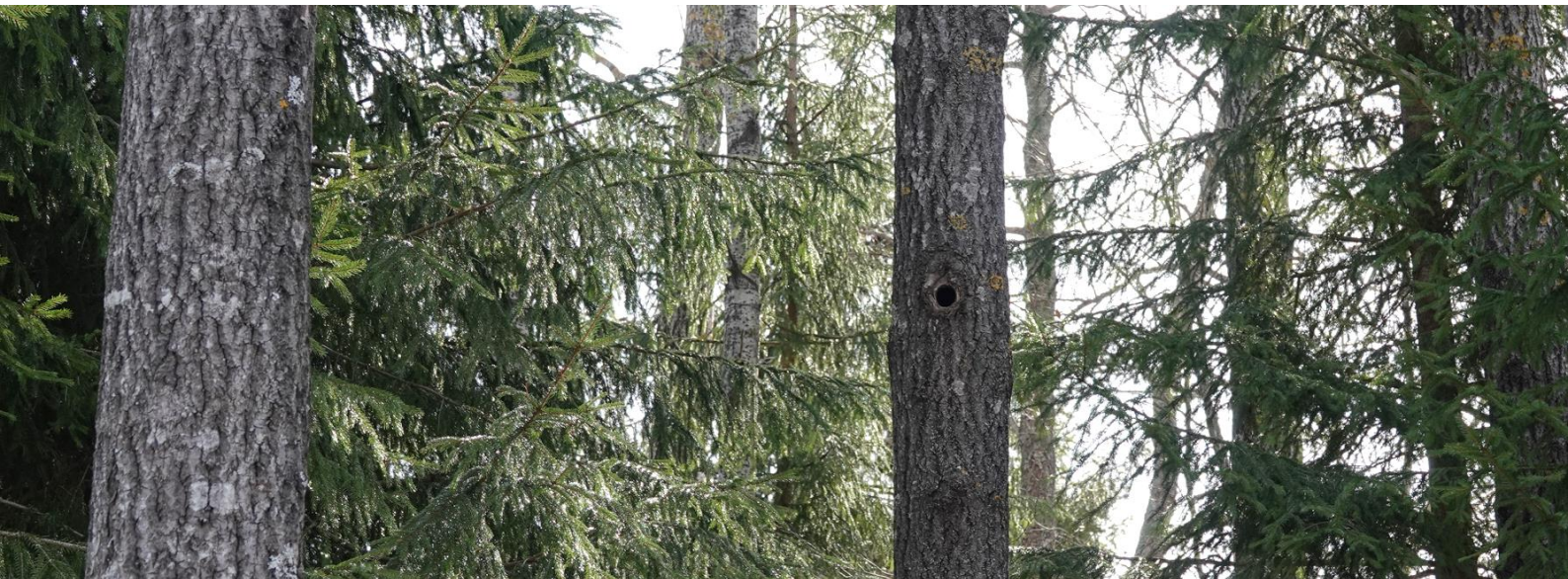
Kuva 1. Mahdollisesti liito-oravalle sopiva tikankolo suunnittelualan läheisyydessä kasvavassa kolohaavassa. Pyhtää 11.4.2023

Koska liito-oravasta ei ole esiintymistietoja lähialueilta, on mahdotonta arvioida, kuinka todennäköisesti laji voisi ilmaantua suunnittelualueelle. Jos alueelta aiotaan poistaa puustoa, on syytä tehdä hakkuut vuoden 2023 puolella. Jos ne tehdään vasta seuraavina vuosina, on syytä tehdä uusi liito-oravatarkistus.