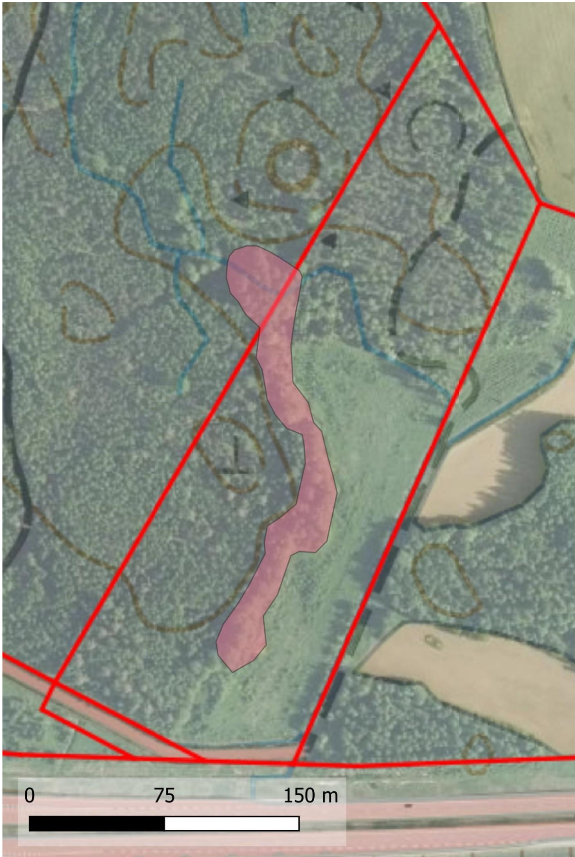
Kartta 2. Liito-oravalle sopivan metsän raja.