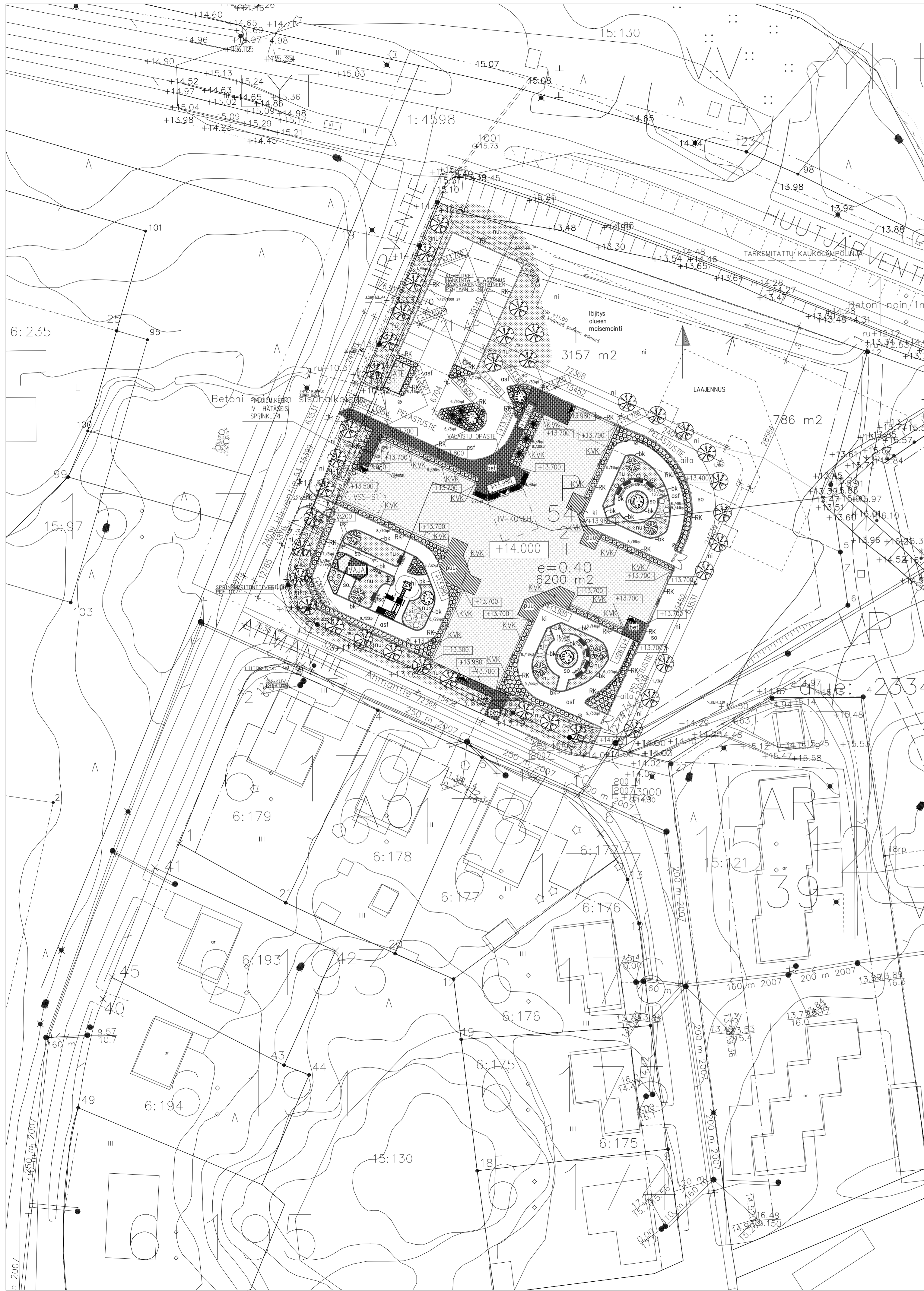
ASEMAPIIRUSTUS, MK 1:500